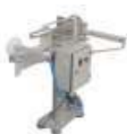
Conferidor de Peso